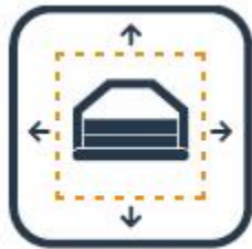
Genoeg ruimte rondom?

Denk goed na over de plek waar het luchtkussen opgebouwd kan worden.