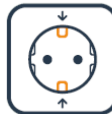
Stopcontact met randaarde