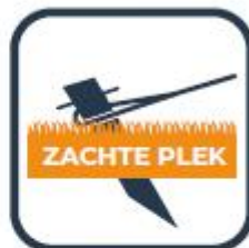
Veranker met haringen