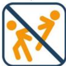
Niet duiken of wild spelen