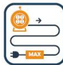
Stroomhaspel helemaal uitrollen