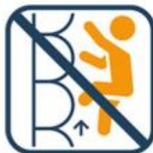
Niet op zijwanden klimmen