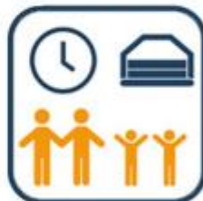
Grote en kleine kinderen wisselen af