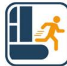
Afstapje snel verlaten