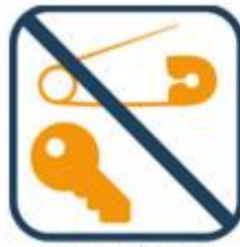
Geen scherpe voorwerpen