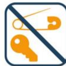
Geen scherpe voorwerpen