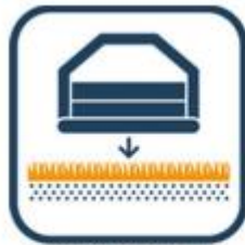
Ondergrond vlak en zacht?