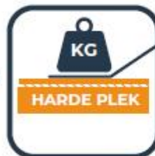
Veranker met ballast