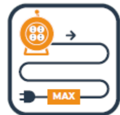
Stroomhaspel helemaal uitrollen