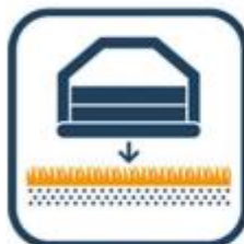
Ondergrond vlak en zacht?