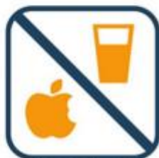
Geen eten of drinken