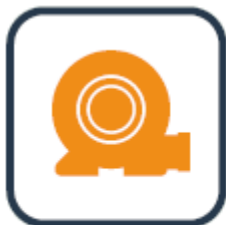
Gebruik meegeleverde blower