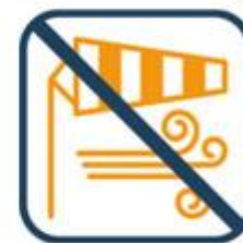
Geen gebruik bij windkracht >5