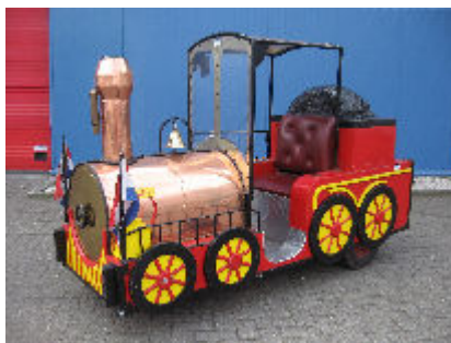
Trein elektrisch C2